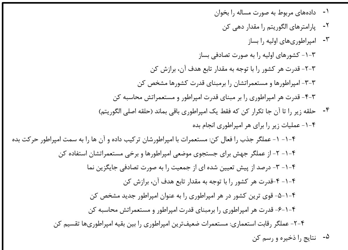
شکل (۱): شبه کد الگوریتم رقابت استعماری

الگوریتم را تشکیل می‌دهند. عملگر جذب برای حرکت دادن مستعمرات به طرف قوی‌ترین کشور هر امپراطوری استفاده می‌گردد. رقابت استعماری شبیه‌ساز رفتار کشورهای استعمارگر برای تحت سلطه درآوردن سایر کشورها است. قدرت کلی امپراطوری بصورت مجموع قدرت کشور استعمارگر به اضافه درصدی از قدرت میانگین مستعمرات آن تعریف می‌شود. یکی از شروط توقف این الگوریتم از بین رفتن تمام امپراطوری‌های ضعیف و یکی شدن همه آنها است [۱۱]. از طرفی الگوریتم رقابت استعماری علی‌رغم عملکرد درخشان در جستجوی فضاهای پیوسته، به تنهایی در بهینه‌سازی مسائل گسسته ناتوان می‌باشد. بنابراین در این مقاله، روشی جهت تلفیق قدرت جستجوی الگوریتم رقابت استعماری و توانایی ابزارهای الگوریتم ژنتیک در بهبود جواب‌های گسسته ارائه گردیده است. در واقع این روش تلفیقی در نتیجه هم‌آهنگ شدن عملگرهای جذب، رقابت استعماری، ترکیب، جهش و تولید تصادفی می‌باشد. شبه کد الگوریتم طراحی شده در شکل ۱ آورده شده است. در بدنه اصلی الگوریتم تلفیقی مورد بحث، عملگر جذب از طریق ترکیب مستعمرات با امپراطورها فعال می‌گردد. به منظور جستجوی محلی جهت ارتقاء بهترین جواب‌های موجود، تعدادی از مستعمرات به همراه تمامی امپراطورها انتخاب شده و جهش می‌یابند.